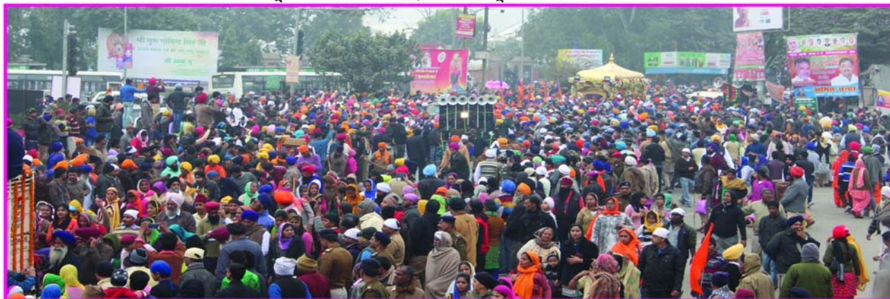
ਸ਼ਰਧਾ ਅਤੇ ਭਾਵਨਾ ਦਾ ਸੁਮੇਲ - ਨਗਰ ਕੀਰਤਨ ਵਿੱਚ ਸ਼ਾਮਿਲ ਸੰਗਤਾਂ ਦਾ ਠਾਠਾਂ ਮਾਰਦਾ ਇਕੱਠ।