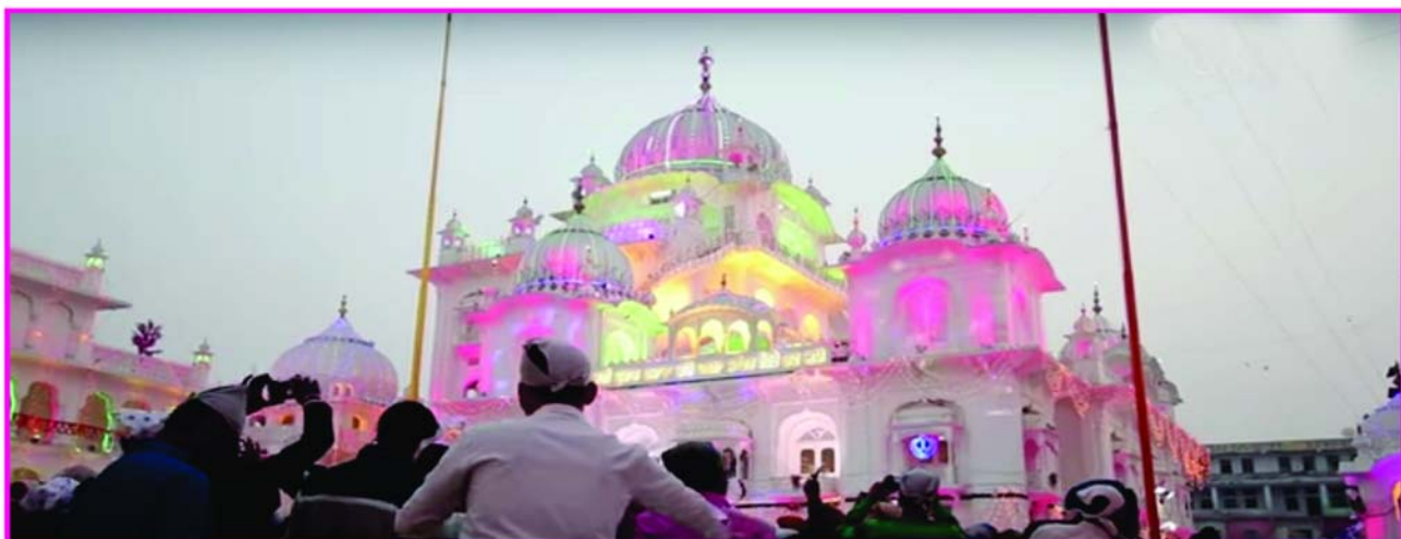
ਸ੍ਰੀ ਹਰਿਮੰਦਰ ਜੀ, ਤਖਤ ਸ੍ਰੀ ਪਟਨਾ ਸਾਹਿਬ