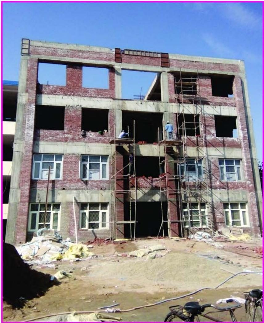
ਗੁਰੂ ਗੋਬਿੰਦ ਸਿੰਘ ਵਿਦਿਆ ਮੰਦਿਰ ਰਤਵਾੜਾ ਸਾਹਿਬ ਵਿਖੇ ਨਵੇਂ ਉਸਾਰੇ ਜਾ ਰਹੇ ਪ੍ਰਸ਼ਾਸਨਿਕ ਬਲਾਕ ਦੀ ਕਾਰ ਸੇਵਾ ।

ਰਾਤ ਦੀ ਵੰਨ ਸੁਵੰਨਤਾ - ਸਾਰੇ ਸ਼ਹਿਰ ਨੂੰ ਲੜੀਆਂ ਨਾਲ ਸਜਾਇਆ ਗਿਆ। ਹਰ ਰਸਤੇ ਨੂੰ, ਹਰ ਸਰਕਾਰੀ ਬਿਲਡਿੰਗ, ਸਕੂਲ, ਕਾਲਜ, ਦਫਤਰ ਆਦਿਕ ਨੂੰ ਰਾਤ ਨੂੰ ਡੈਕੋਰੇਟ ਲਾਇਟਾਂ ਨਾਲ ਸਜਾਇਆ ਹੋਇਆ ਸੀ। ਦਰਸ਼ਨ ਕਰਕੇ ਮਨ ਗਦ-ਗਦ, ਅਸ਼-ਅਸ਼ ਹੋ ਰਿਹਾ ਸੀ।